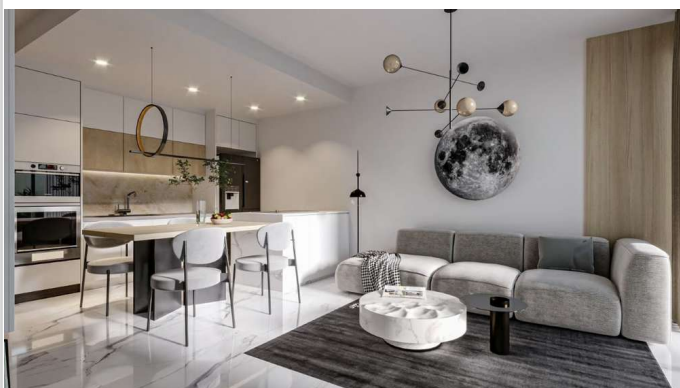
Wohnen/ Essen/ Kochen

Zimmer: 2,00 Wohnfläche ca.: 58,00 m 2 Kaufpreis: 153.900,00 EUR