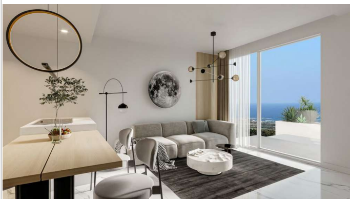
Wohnen/ Essen/ Kochen