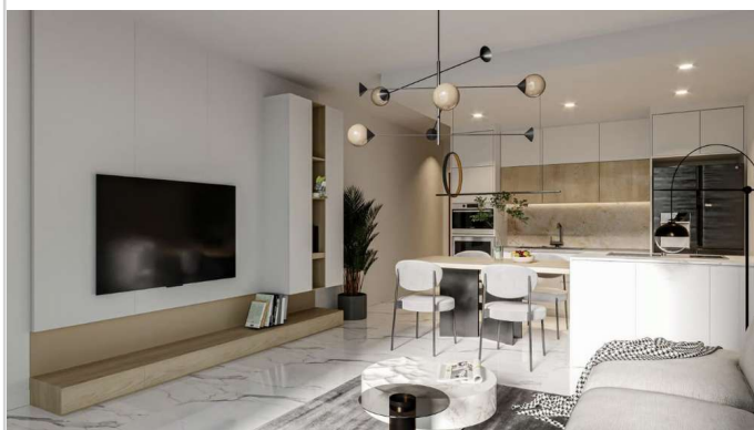
Wohnen/ Essen/ Kochen