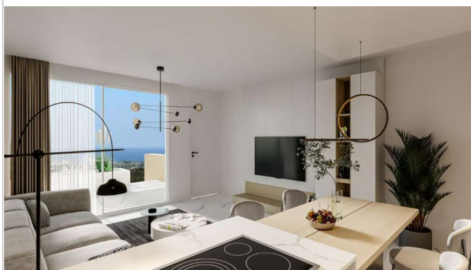
Wohnen/ Essen/ Kochen