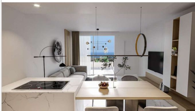
Wohnen/ Essen/ Kochen