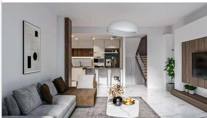
Wohnen/ Essen/ Kochen