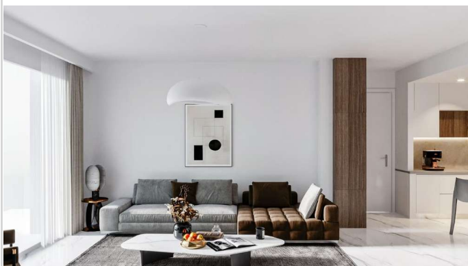
Wohnen/ Essen/ Kochen