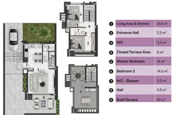
3-ZK2B-Villa Karpas Grundriss