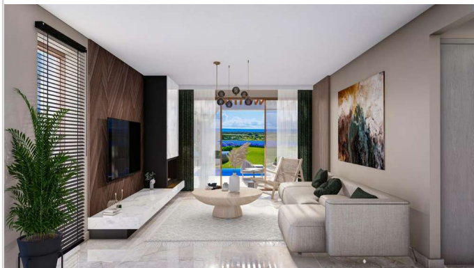
Wohnen/ Essen/ Kochen