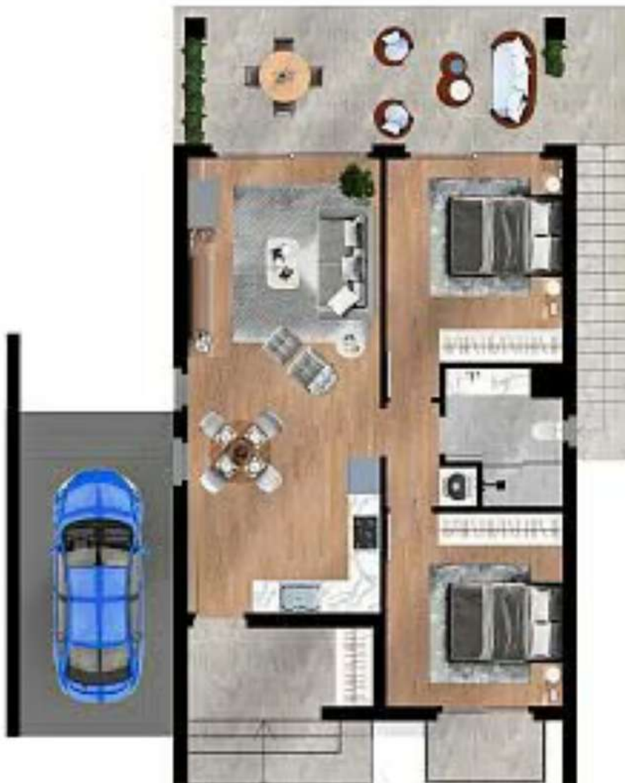
Villa 83m 2 Karpas

Zimmer: 3,00 Wohnfläche ca.: 83,00 m 2 Kaufpreis: 333.900,00 EUR