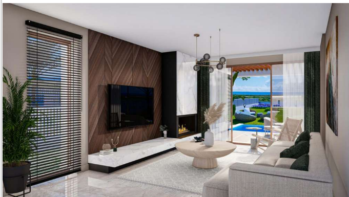
Wohnen/ Essen/ Kochen

Zimmer: 3,00 Wohnfläche ca.: 83,00 m 2 Kaufpreis: 333.900,00 EUR