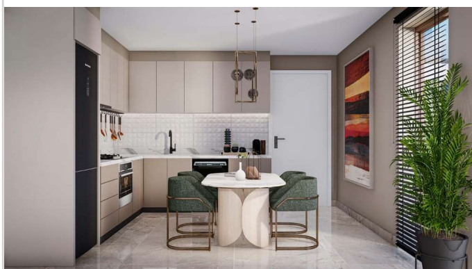
Wohnen/ Essen/ Kochen